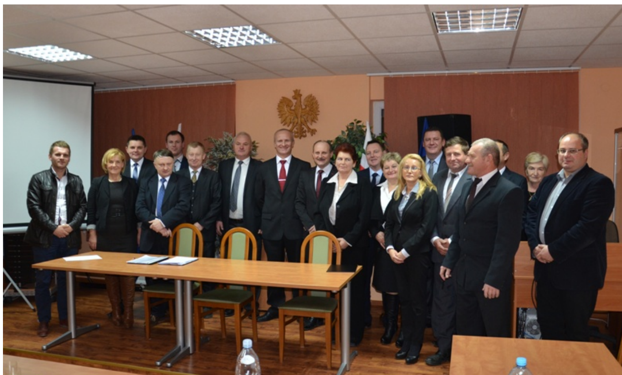
Rada Gminy Szastarka kadencja 2014-2018